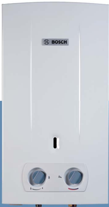
Therm 2000 O — зручність за доступною ціною

Bosch Therm 2000 O дозволяє максимально швидко нагріти воду. Все, що необхідно, — це лише відкрити кран і отримати до 10 л/хв гарячої води. Безпечність і надійність експлуатації гарантує наявність 4 елементів: пристрою контролю тяги з автоматичним відключенням водонагрівача, іонізаційного електроду контролю полум'я, обмежувача температури, що захищає теплообмінник від перегріву і запобіжно-скидного клапана.